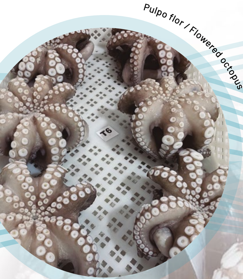
Pulpo flor / Flowered octopus

Los chocos son eviscerados, lavados detalladamente quitando toda su piel, cartilagos excedentes, rejos, sin picos ni ojos. NO usamos ningun tipo de engorde o blanqueante, ni agregamos glaceos. Los confeccionamos en bloque e IQF en cajas de aprox 10 kg.