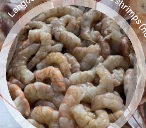
Langostino pelado / Peeled shrimps (notialis)