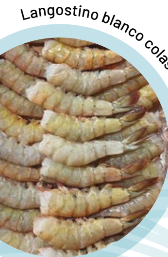
Langostino blanco colas / White shrimps tails

We process a wide range of local fishes, ribbon fish, grouper, croaker, tiger soles, lengua, whole round, HGT or like for the soles fully skinned, we use NO any chemicals or add any glaze to our products.