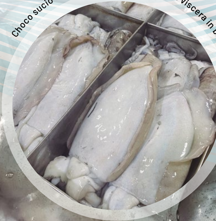
Choco sucio en bloques / Cuttlefish with viscera in blocks