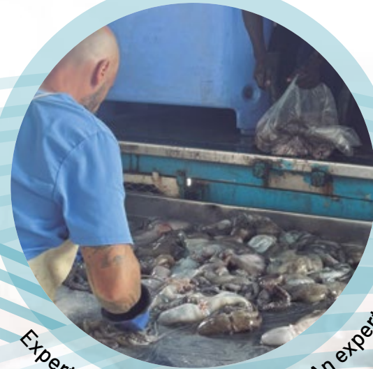
Experto seleccionando pulpos / An expert selecting octopuses