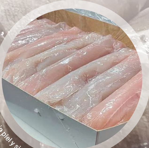
Filetes de lengua sin piel y sin espinas iwp / Tongue sole fillets