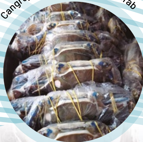
Cangrejo azul IWP / Blue IWP crab