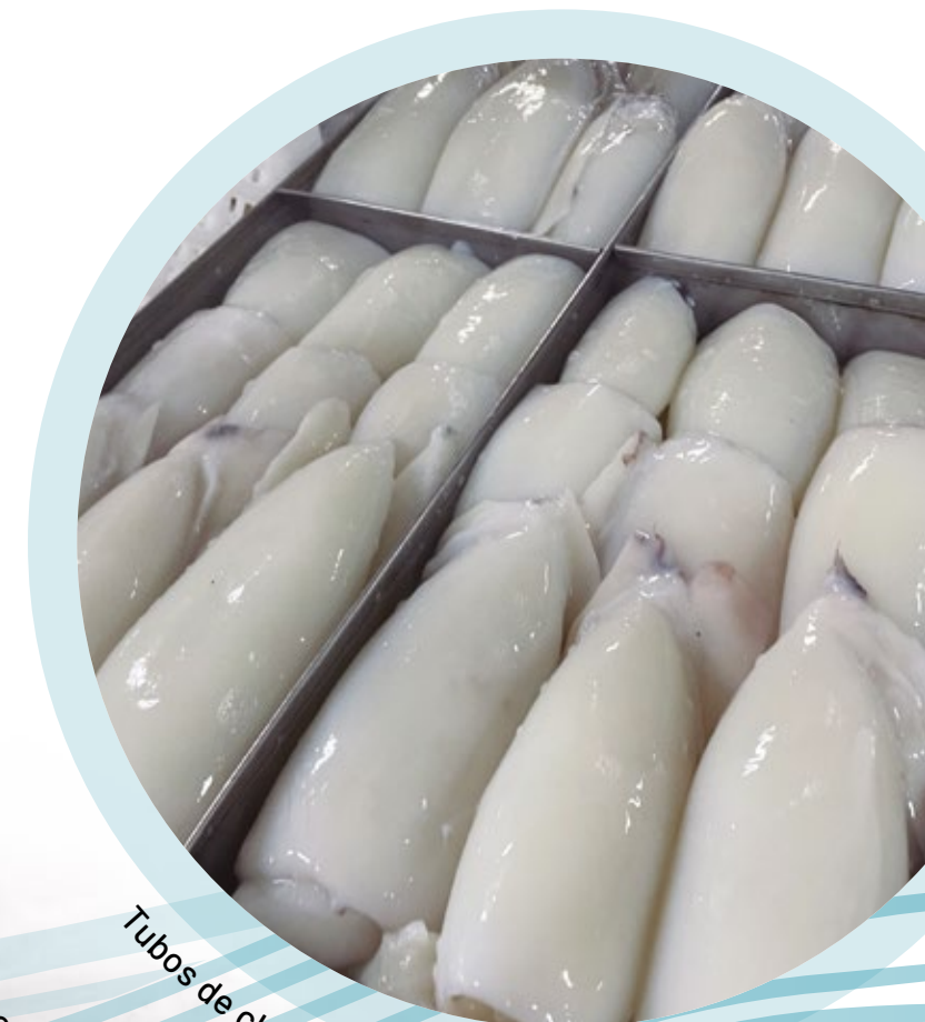
Tubos de choco limpio / Cleaned cuttlefish