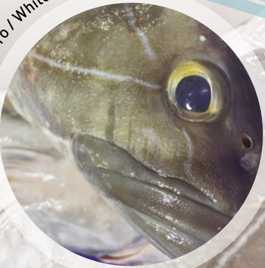
Cherne entero / White grouper