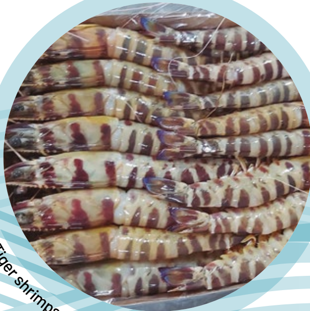
Langostino tigre entero / Tiger shrimps