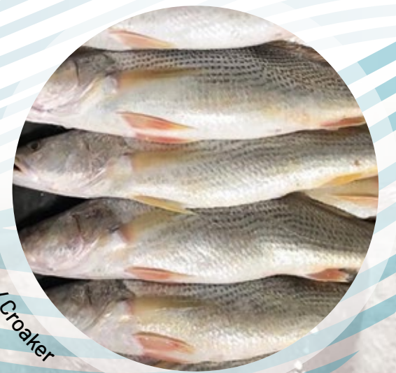
Corvinato entero / Croaker