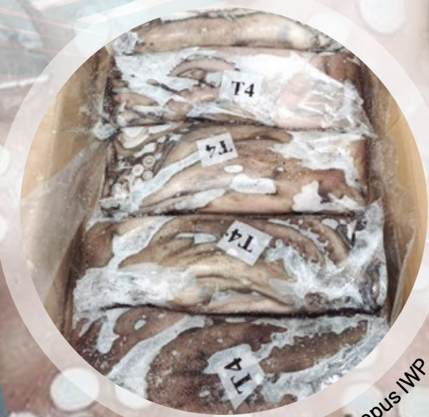
Pulpo IWP / Octopus IWP