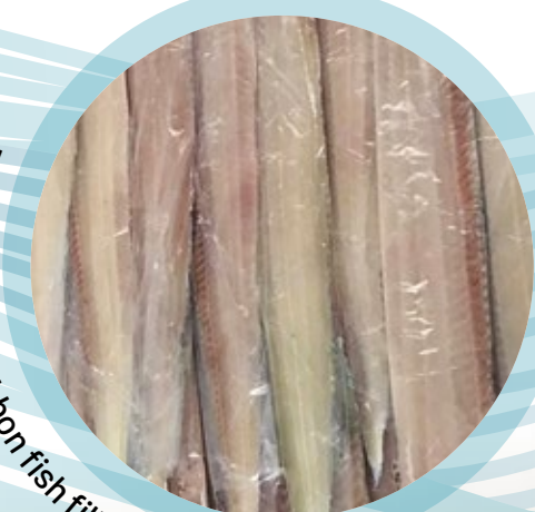
Filetes sable / Ribbon fish fillets