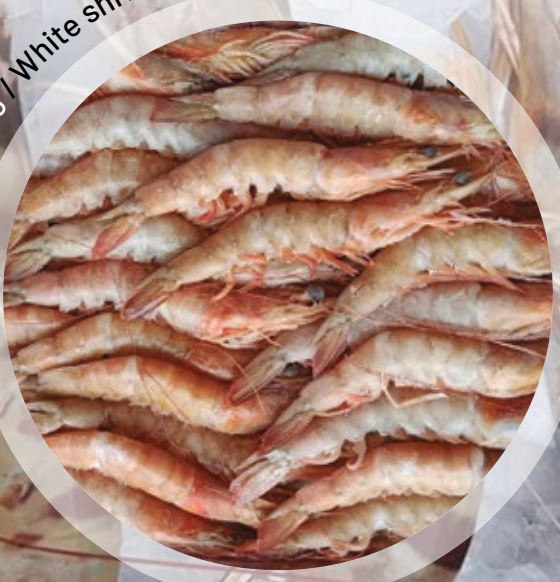
Langostino blanco entero / White shrimps (notialis)