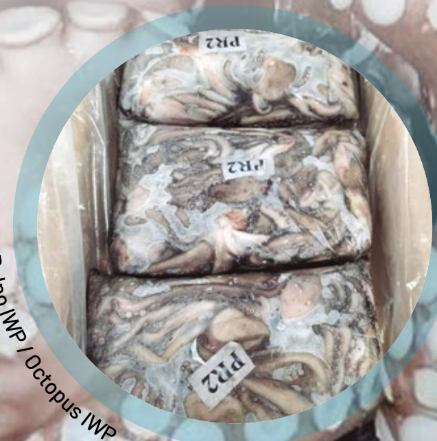
Pulpo IWP / Octopus IWP