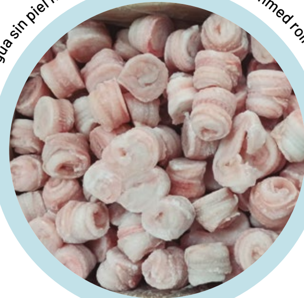
Filetes de lengua sin piel ni espinas en rolls / Red sole trimmed rolls